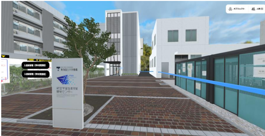
航空宇宙生産技術開発センター外観

企業間で語ろう、学生と語ろう！！ 企業の業務改善成功体験（我社の改善事例、会社紹介、我社の未来）