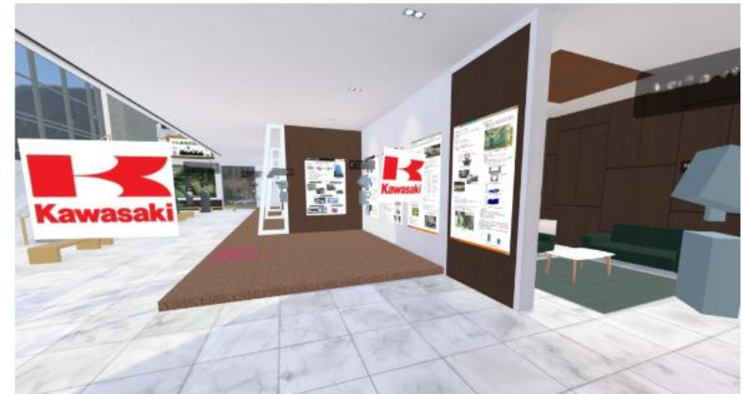
展示会場ブースの様子