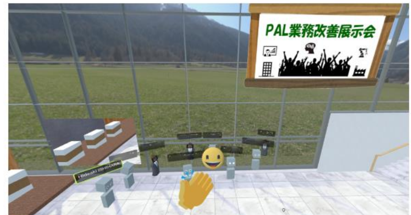
展示会説明員の集合写真