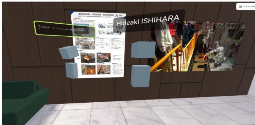
資料を展示説明する様子