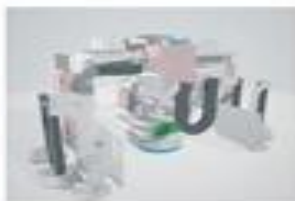
3D CAD データ